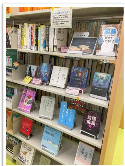
▲ ブックハンティングコーナー