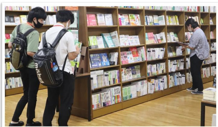
▲ ブックハンティングの様子

図書館の改修と新型コロナウイルス感染拡大防止対策により、令和元年度から令和4年度まで中止していたため、今年度、5年ぶりの実施となりました。令和5年度は9月5日(火)に盛岡市のジュンク堂書店で実施し、学生6名が参加しました。参加学生に書店内を探索してもらい、専門書その他、文学、社会科学、自然科学など、様々なジャンルから46冊の本を選んでもらいました。選んでもらった本は【ブックハンティングコーナー】へ配架しています。